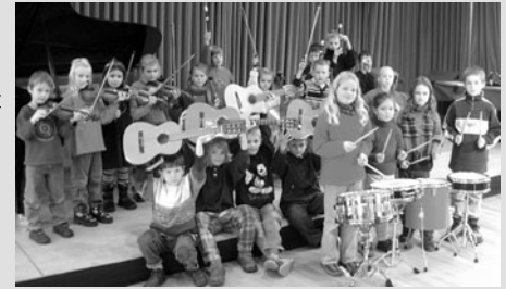
»Musizieren macht Spaß!«

Erleben Sie ein buntes und abwechslungsreiches Programm, das sich unter dem Motto »Musizieren macht Spaß« besonders an Kinder der Grundschulen mit ihren Familien richtet.