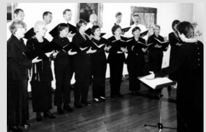
»Forum Vocale Arnsberg«

Das Ensemble »Lautmalerey«, ausgestattet mit einem reichen Instrumentarium, präsentiert einen Überblick verschiedener Klänge aus 400 Jahren Musikgeschichte. Das »Forum Vocale Arnsberg« besteht als Kammerchor seit 1985 und widmet sich vor allem weltlicher Chormusik von der Renaissance bis hin zu modernen Sprechchorstücken. – Beide Gruppen verbindet eine langjährige Zusammenarbeit.