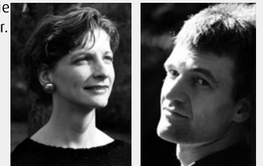
...Lieder und Arien im Susato Saal der Musikschule

Beide verbindet der Wunsch, ihre große sängerische Erfahrung an interessierte Laien sowie an werdende Profis weiterzugeben. Neben der Arbeit bei »Alma Viva« und der künstlerischen und pädagogischen Tätigkeit arbeitet das Sängerpaaar mit der Musikschule Soest zusammen.