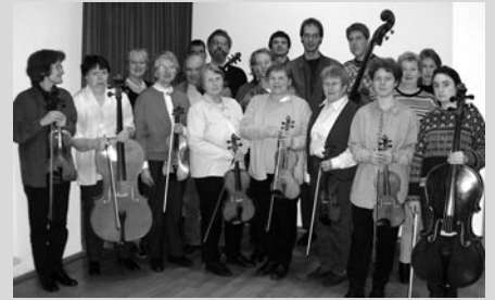
...Orchesterkonzert in der Hohnekirche

Von dem zeitgenössischen baltischen Komponisten Arvo Pärt ist ein unbekanntes Werk, »Summa« für Streichorchester, zu hören – ursprünglich eine Vertonung des Credo für chorische Besetzung. Das Concerto in d-moll für zwei Violinen von Antonio Vivaldi wurde von J. S. Bach für Orgel umgeschrieben.