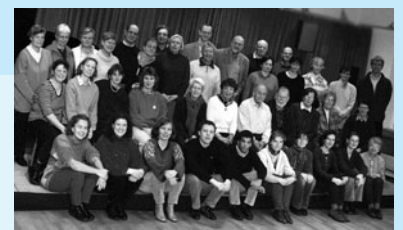
Chor des Städt. Musikvereins Soest