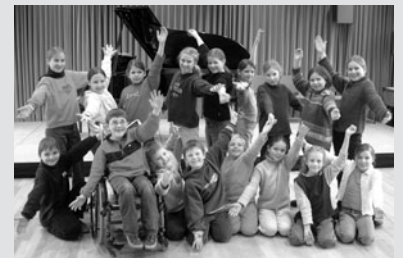
»Musical macht Spaß!«

Also: Auf geht's zum Schloss Eulenstein, wo alle Geister sehnsüchtig darauf warten, wieder einmal spuken zu dürfen. Und dazu laden wir alle kleinen und großen Kinder herzlich ein – huhuu...!