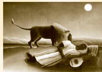
Henri Rousseau: »Die schlafende Zigeunerin«