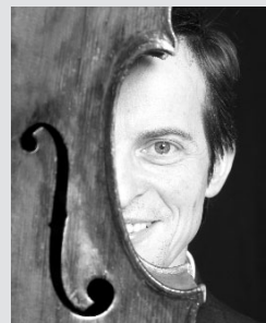
»Ein Fall für das Cello«