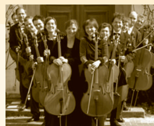
Die zwölf Hellweger Cellisten