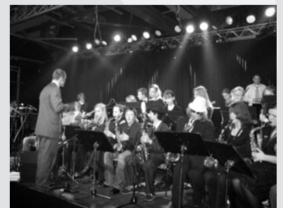
Burning Big Band live

Unter dem Motto »Atemgold« wird das Jugendblasorchester Highlights aus dem Bereich Filmmusik aufführen, die Big Band präsentiert danach unter anderem Arrangements aus den Songbooks der Big Bands von Count Basie, Buddy Rich und Bob Mintzer. Beide Formationen freuen sich schon auf einen anspruchsvoll-unterhaltsamen Konzertabend.