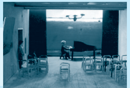
»Malsturz« - Bühnenbild

In diesem außerordentlichen Projekt verschmelzen Musik und Malerei zu einer Einheit. Die Künstler treten während der Aufführung in einen intensiven Dialog, indem für ausgewählte Klaviermusikstücke eine fahrende Leinwand entwickelt und bemalt wird, mit dem Ziel der wechselseitigen Inspiration der unterschiedlichen Kunstdisziplinen. Bilder werden gehört, die Musik wird gesehen – die Leinwand wird zur Projektionsfläche für Poesie.