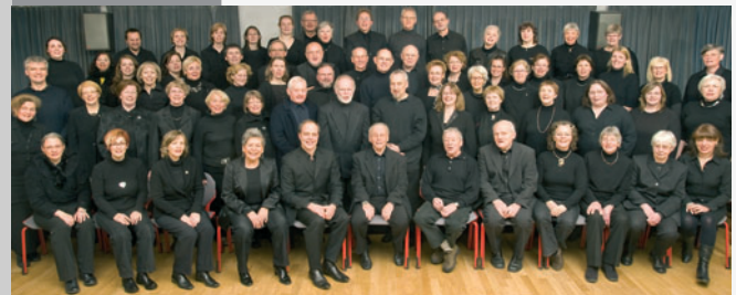
MUSIKVEREINS - CHOR